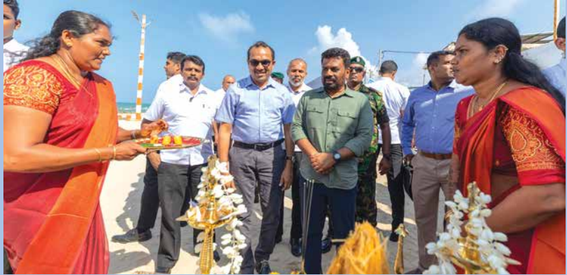
බිඳුණු සිත් යාකරන ගමනක...