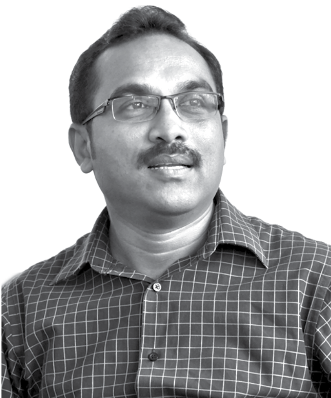
ප්‍රවාහන, මහාමාර්ග, වරාය සහ සිවිල් ගුවන් සේවා අමාත්‍ය, පාර්ලිමේන්තු සභානායක බිමල් රත්නායක සහෝදරයා

දැන් අපේ අරමුණ විය යුත්තේ ඒ මගේ ගමන් කිරීමය. ජාතික පුනරුදයක් ඇති කරමින් සැබෑ ජාතික නිදහස අත්පත් කර ගැනීම සඳහා මෙතැන් සිට අප කටයුතු කළ යුතුය.