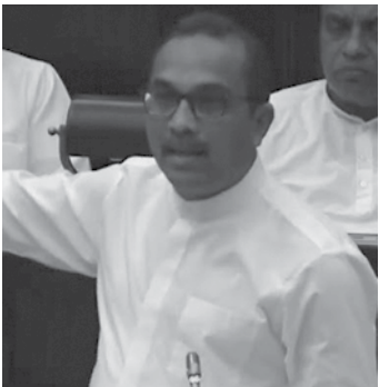
ප්‍රවාහන, මහාමාර්ග, වරාය සහ සිවිල් ගුවන් සේවා අමාත්‍ය බිමල් රත්නායක සභෝදරයා

සදාචාර බලයක් ගොඩනගලා තිබෙන්නේ. කාටවත් හෙළවෙන්න බැහැ. අපට පවා හෙළවෙන්න බැහැ. ඒක moral power එකක්. ඒක political social විතරක් නොවෙයි. moral power එකක්. අපට පවා ඒක එතුමන්ලාගේ දෙයක්. Singaporeවල, USAවල, Chinaවල මේ වාගේ වැඩසටහන් ක්‍රියාත්මක කර තිබෙනවා. ලෝකයේ හැම රටකම නිදහස් අරගලවලින් ඉස්සරහට එනකොට ඒ විධියට