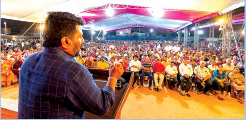
තඹුන්තේගම සුභද හමුව අතරතුර...