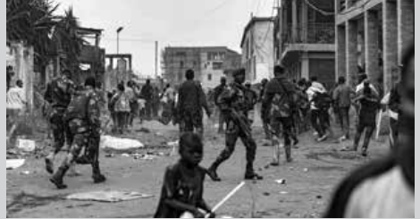
කොංගෝව රුවන්ඩාවේ පවතින කොංගෝ තානාපති කාර්යාලයේ නිලධාරීන් ආපසු ගෙන්වාගැනීමට පසුගියදා කටයුතු කර තිබුණි. එසේම

කොංගෝවේ තිබූ රුවන්ඩා තානාපති කාර්යාලය වසා දැමීමටද පියවර ගෙන ඇත.