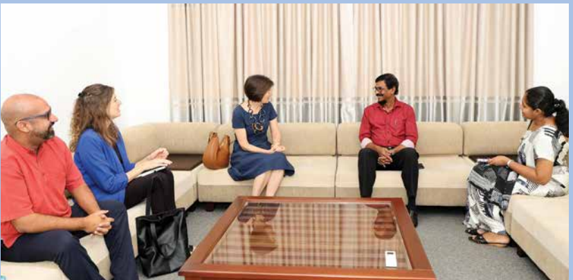
ස්විට්සර්ලන්තයේ තානාපතිනිය හමුවී...