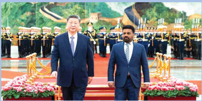
චීන සංචාරය අතරතුර...