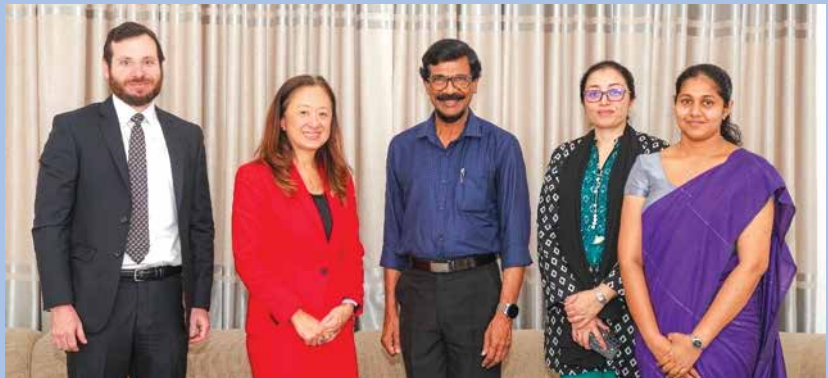
ඇමරිකා එක්සත් ජනපද තානාපතිනිය සමග...