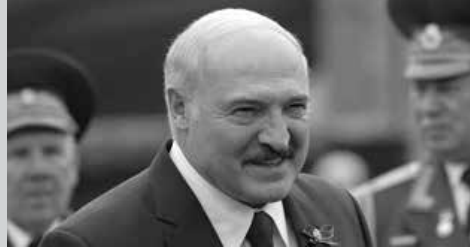
සෝවියට් දේශයේ බිඳවැටීමෙන් පසු නව රාජ්‍යයක් ලෙස ස්ථාපනය වූ බෙලරුස්හි ප්‍රථම ජනාධිපතිවරයා ලෙස 1994දී තේරී පත්වූ

ඇලෙක්සැන්ඩර් ලුකාෂෙන්කෝ මෙවර ජනාධිපතිවරණයෙන්ද නැවත ජයග්‍රහණය කර ඇත. 1994 සිට අද දක්වා සියලු ජනාධිපතිවරණ ජයග්‍රහණය කර ඇති ලුකාෂෙන්කෝ මේ ආරම්භ කිරීමට සූදානම් වෙන්නේ සිය 7වැනි දූර කාලයයි. පසුගිය ජනවාරි මස 26වැනි දින පැවති ජනාධිපතිවරණයෙන් 86.8%ක ඡන්ද ප්‍රතිශතයක් ලබාගැනීමට ඔහු සමත්ව ඇත.