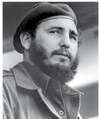
"මාධ්‍ය මගින් කරන්නේ බොරු කියන එක පමණක් නොවේ. සාමාන්‍ය පුද්ගලයන්ගේ අතීත කිරීමයි. බොරුව හා සාමාන්‍ය පුද්ගලයන්ගේ යනු වර්ග දෙකකි. බොරුව දැනුම මත සාමාන්‍ය බලපෑමක් ඇති කරනවා. සාමාන්‍ය පුද්ගලයන් වින්තනය මත සාමාන්‍ය බලපෑමක් ඇති කරනවා. එය තොරතුරු විසන්ධිවීමට හෝ විකෘති කිරීමට සමාන හැඟේ. එමගින් සිදුවන්නේ සිතීමට ඇති හැකියාව මොට කිරීමයි."