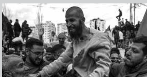
පලස්තීනයේ ගාසා තීරයේ මාස 15ක් පමණ තිස්සේ අබණ්ඩව පැවති යුද තත්වය තාවකාලිකව සමනය වී

ඇත්තේ සටන් විරාමයක් සඳහා දෙපාර්ශ්වය එකඟතාවයට පැමිණීමක් සමගයි. ඒ එකඟතාවයන්ගේ කොන්දේසි අනුව දෙපාර්ශ්වය විසින් සිය ග්‍රහණයේ සිටින සිරකරුවන් හුවමාරු කරගැනීම ආරම්භ කර ඇත.