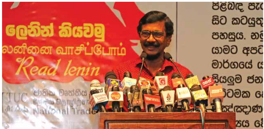
ජනතා විමුක්ති පෙරමුණේ ප්‍රධාන ලේකම් විල්වින් සිල්වා සහෝදරයා

මේ වගේ තත්වයන් ගැන ලෙතින් සහෝදරයාගේ කෝරා ගත් කෘති 8 වැනි වෙළුමේ මෙහෙම කියනවා. "සුපුරුදු ධනපති සම්බන්ධකම් පිළිබඳව පැරණි රජ දහන තුළ සිට කටයුතු කිරීම සරලය, පහසුය. නමුත් අලුත් මාවතක යාමට අපට උවමනාවී තිබේ. එම මාර්ගයේ යාම සඳහා අප සහ ජනතාව කෙරෙහි උසස් මට්ටමක දේශපාලන විඥානයක් හා සංවිධානයක් අවශ්‍යය. ඒ සඳහා වැඩි කාලයක් අවශ්‍ය වන අතර එහිදී වඩාත් බරපතළ වැරදි සිදුවේ. නමුත් වැරදි නොකරන්නේ ප්‍රායෝගික වශයෙන් යම්කිසි මට්ටමට ප්‍රයත්න නොදරන අය පමණක් බව අපි කියන්නෙමු." මේ ප්‍රකාශය හරිම පැහැදිලියි. පැවති ක්‍රමයම ගෙනයනවා නම්, අපට පහසුයි, සරලයි. එහෙම ගියා නම් රජයේ ආයතනවලට තමන්ගේ නැදැයෝ දාගන්නවා; කොන්ත්‍රාත් නැදැයන්ට ලබාදෙනවා; කොමිස් ගහනවා; හොඳම වාහන ටික ගන්නවා; ගෙවල් ටික අල්ලා ගන්නවා; විනෝද වෙනවා. පැරණි ක්‍රමයට ගියා නම් සිදුවෙන්නේ මිය දේවල්. අපිට උදව් කරපු කට්ටියන් සන්නාමයෙන් ඉන්නවා. නමුත් අලුත් මාර්ගයකට යාම සඳහා පක්ෂය