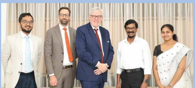
බ්‍රිතාන්‍ය මහ කොමසාරිස් හමුවී...