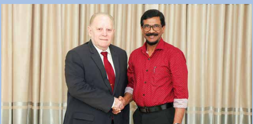
ශ්‍රී ලංකාවේ කියුබානු තානාපති සමග...