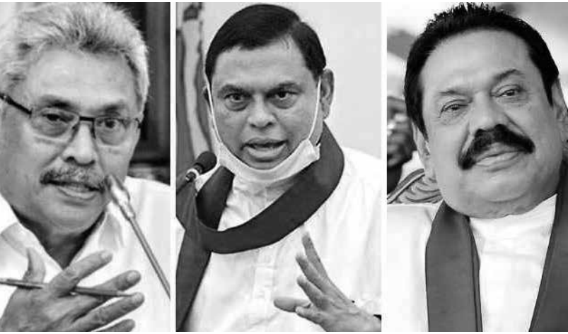
දහවල් කථාවට ඔහු තවත් කැල්ලක් එකතු කළේය. එනම් "මොකද මමත් නිතිඥයෙක්නෙ" යන්නයි. ඒ ප්‍රකාශයෙන් ඔප්පු වුණේ තමන් ඇතුළු කල්ලිය මේ මහා සාපරාධී අපරාධය කළාය කියා පිළිගැනීමය. ඉන් පැය කිහිපයකට පසු "මේක හරිම ප්‍රශ්නයක් උනානෙ" කියා එක්කෝ ඔහුට සිතෙන්නට ඇත. නැතිනම් ළඟ හිරිය එකක් මතක් කර දෙන්නට ඇත. නැවත හතර වටයක් කැරකැවී හවස ප්‍රකාශය කළේ ඒ නිසා විය හැකිය. එසේ නැතිනම් මේ මොහොතේ ජීවත්වන මහින්දගේ ජීව විද්‍යාත්මක තත්වය අනුව අරවිධියේ දේවල් කටින් පිටවෙනවා විය හැක. අපි ඇත්ත ජීවියා ලෙස හදුනාගත යුත්තේ දවල් මහින්දට එරෙහිව, හවස මහින්දද නැතිනම් හවස මහින්දට එරෙහිව දවල් මහින්දද? කෙසේ වෙතත් එකක් පැහැදිලිය. ඒ, මේ මහින්දලා දෙදෙනාම ජනතාවට එරෙහිව බවය. මහින්දලා ප්‍රමුඛ මේ සාපරාධී නඩය මේ අපරාධය තම පෞද්ගලික කේන්තරකාරයෙකුට කළ එකක් නොව, එය දෙකෝටි විසිපත් ලක්ෂයකට ආසන්න, මහල්ලාගේ සිට කිරි දරුවා දක්වාද හෙට උපදිමට පෙරාම් පුරන කිරිකැටි බිළිදාටද එරෙහිව කළ ලක් ඉතිහාසයේ ලොකුම අපරාධයයි. මේ වියරු පිහාවයින්ට නිසි දඬුවම් දීමට නම් ජනතා පාලනයක් යටතේ ජනතා අධිකරණයක්ම ආ යුතුය.

ලාංකේය සමාජය මුහුණ දී ඇති වත්මන් අර්බුදයේ මෑතකාලීන වගකිවයුත්තන් මහින්ද, ගෝඨාභය, බැසිල් තුන්බෑ ජවලයන් ප්‍රමුඛ නඩය බව පසුගියදා මෙරට ශ්‍රේෂ්ඨාධිකරණය තීන්දු කළේය. ශ්‍රේෂ්ඨාධිකරණයේ තීන්දුව එසේ වුවද රටේ සාමාන්‍ය ජනයාගේ අදහස නම් අදාළ ලැයිස්තුව තවත් විශාල හා පුළුල් විය යුතු බවය; දිගු විය යුතු බවය. මේ තීන්දුව දුන්පසු මහින්ද රාජපක්ෂ නම් අරුම පුදුම ජීවියා අපුරු ප්‍රකාශ දෙකක් කළේය. එකක් මහ දවල්ය. එකක් සවස් භාගයේය. "අපි අධිකරණ තීන්දුවට කිය නමනවා" යන්න, දහවල් එකය. "අපි එම තීන්දුව පිළිගන්නෙ නෑ. අර්බුදයට අපි වගකිව යුතු නෑ" යන්න හවස එකය.