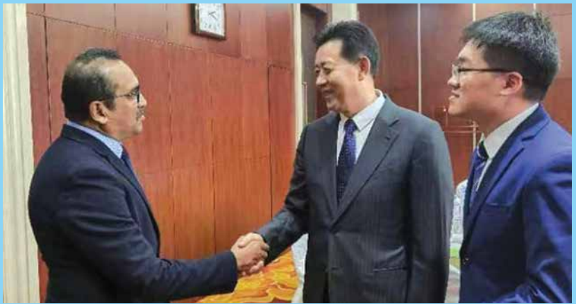
ලෝක සාම මණ්ඩලයේ නියෝජිතයන් සමග...