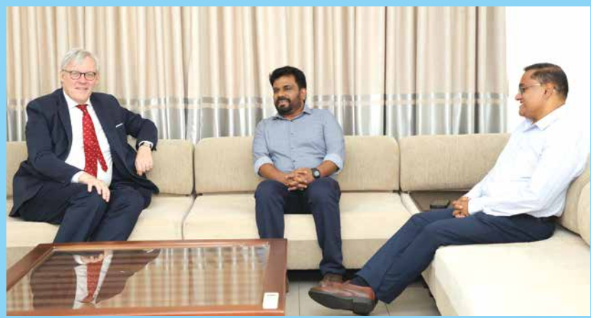
මුනාහස මහ කොමසාරිස් හමුවී...