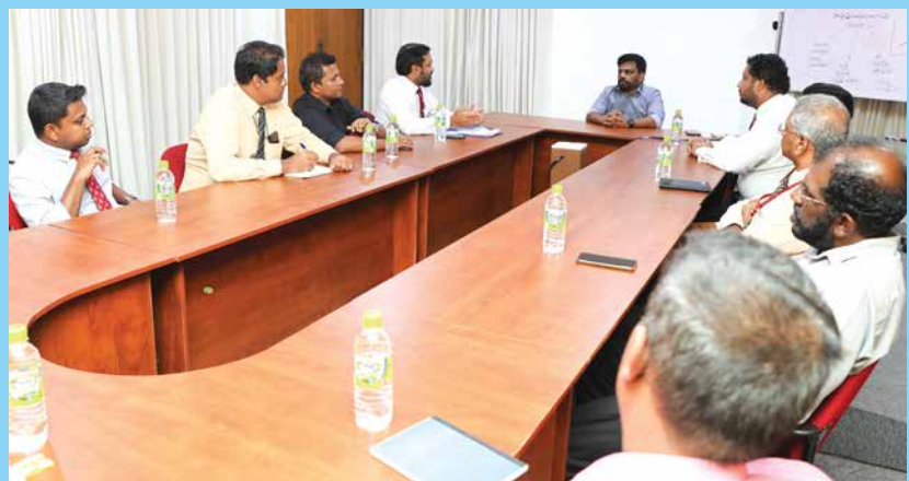
වෘත්තීයවේදීන්ගේ ගැටලු විමසමින්...