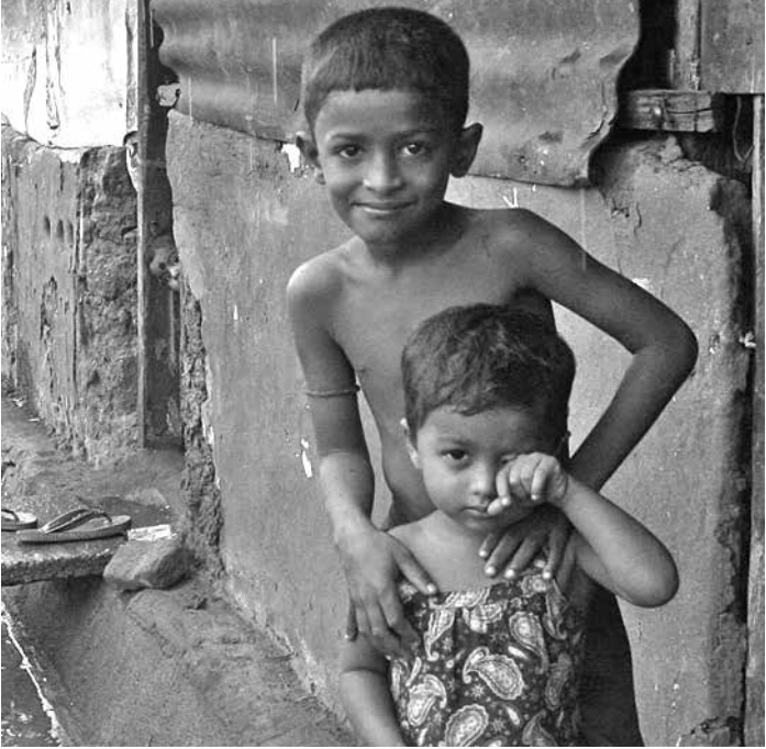
අද ලාංකේය මිනිසා සුරාකෑමේ හොඳික සම්මතයට පමණක් නොව විද්‍යානමය සම්මතයටද පාත්‍රවී තිබේ. ලාංකේය සමාජ ව්‍යාපාරයේ කර්තව්‍ය සංකීර්ණ සහ දුෂ්කර වී ඇත්තේද මෙකී ඉහත කී සාධක නිසාය. එහෙත් ඒ අසීරුතාවයෙන් මේ සමාජය ලැබූ ගත යුත්තේද ඊටත් වඩා අසීරු ප්‍රයත්නයක් මගින්ම පමණි. ලාංකේය ජනයාට දැනට ඉතිරිව තිබෙන එකම සැනසීම එවන් අභියෝගයකට මුහුණ දිය හැකි සමාජ ව්‍යාපාරයක් මේ භූමිය තුළ සක්‍රීයව පැවතීමය.

ලංකාවේ සමාජ අර්බුදය, තැන්පත් දේශපාලන මනසකින් කියවා ගන්නෙකුට වැටහී යන දෙයක් තිබෙයි. එනම් ලාංකේය සමාජයේ බහුතරයක් දෙනා හිතන්නේ 'පෞද්ගලිකව' මිස 'සමාජීයව' නොවෙන බවය. එනිසා ඔහු බොහෝවිට කරන්නේ මේ අර්බුදය ඇතුළේ පුද්ගල කේන්ද්‍රීය ගණන් බැලීමය. ඊනියා නිදහස ලැබ වසර 75ක් ගත කළ, වසර 2500ක උදාර සවිමත් සංස්කෘතියකට උරුමකම් කියන්නේ යැයි සම්මත සද්ගුණවත් මිනිසාගේ ඒ ගෙවුණු වසර 75 දිනා බලන විට ඔහු ඉතිරි කරගත් ශේෂ පත්‍රයේ හැම අයිතමයක්ම සෑණ අගයකට හිමිකම් කියයි. මෑත කාලීනව විශේෂත්වය නම්, එම සෑණ අගය ළඟ ළඟම වේගවත් වීමය; වසරින් වසර වේගවත් වීමය. පුද්ගල කේන්ද්‍රීයව දේශපාලනය ගණන් තබන මිනිසා නිරන්තරයෙන්ම කළේ දේශපාලනය වෙනුවට පුද්ගලයන් මාරුකිරීමය. එම අවිද්‍යානමය මිනිසාගේ පිහිටෙන් වත්මන් බලය හොබවන රනිල් රාජපක්ෂ ආණ්ඩුවද 2023 අවසානයට රටට ඉතිරි කර තිබෙන්නේ මොනවාද? සියලු ආහාර නිෂ්පාදනයන් සෑණ අගයකට පහත හෙළා ඇත. කාර්මික හා කෘෂිකර්මික නිෂ්පාදනයන් එලෙසය. අධ්‍යාපනය නැතිකර ඇත. සෞඛ්‍යය නැත්තටම නැති කර ඇත. බඩු මිල අකනිටා බමලොවටම නග්ගවා ඇති අතර, පිටි, කිරිපිටි, සහල් ඇතුළු අත්‍යවශ්‍ය භාණ්ඩ අත්‍යවශ්‍ය භාණ්ඩ බවට පත්කර ඇත. සීනි 'සිහිනෙන් දිව ගෑ' රසයක් බවට පත්කර ඇත. අවසානයේ ශ්‍රී ලංකාව කියන හොඳික රාජ්‍යයද විකුණාගෙන කමිත් නැති බැව් එකාවම වජප කර දමන තුරුම ණය බර බදු බර වැඩිකරමින් ශ්‍රී ලාංකීය රාජ්‍ය සංකල්පීය රූපයක් දක්වා වාෂ්ප කෙරෙමින් තිබේ.