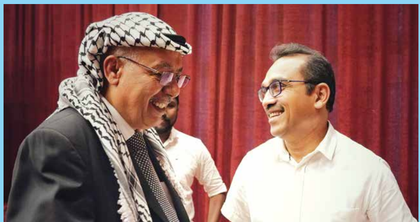
පලස්තීන සහයෝගිතා දිනය සැමරීමට එක්වී...