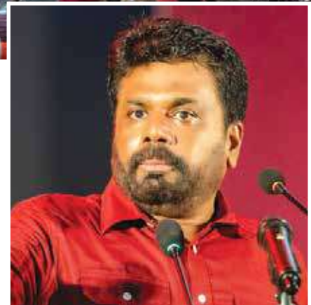
ජනතා විමුක්ති පෙරමුණ නායක අනුර කුමාර දිසානායක සභෝදරයා

“අපි ජනතාවට අවංකවම ආදරය කරන්න ඕනෑ. ඔවුන්ගේ අපේක්ෂාවන් මුදුන්පත් කරගැනීම සඳහා අපි අවංකවම වැඩ කරන්න ඕනෑ. පතුළෙන්ම එන අවංකභාවයෙන් අපි පෝෂණය වෙන්න ඕනෑ. අන් කවරාදාටත් වඩා වැඩියෙන් මේ ව්‍යාපාරයට සාමූහිකත්වය අවශ්‍යයි. දේශපාලන ජයග්‍රහණයක් තුළ අපේ පංශුව අත්කර ගැනීම සඳහා ගොඩනැගිය හැකි මානසිකත්වය දැන් තබාම අත්හැරිය යුතුයි. ඒ සෑම තැනකම තිබෙන්නේ අපි හැමෝගෙම සාමූහික කොටස්. ජයග්‍රහණ අත්කර ගත හැකි වන්නේ, මහා මිනිස් සමාජයට නායකත්වය දියහැකි හැකියාවන් සහ දක්ෂතාවයක් තිබෙන කොටස් උරා ගැනීමෙනි.” අපි මේ ඉල්ලමහ සමරුවට සමරන්නේ ඉතාමත් වැදගත් ඓතිහාසික අවස්ථාවක. සමාජය පරිවර්තනය කිරීම සඳහා මහා හඩක් රට තුළ පමණක් නොවෙයි, එක්සත් ජනපදයේ