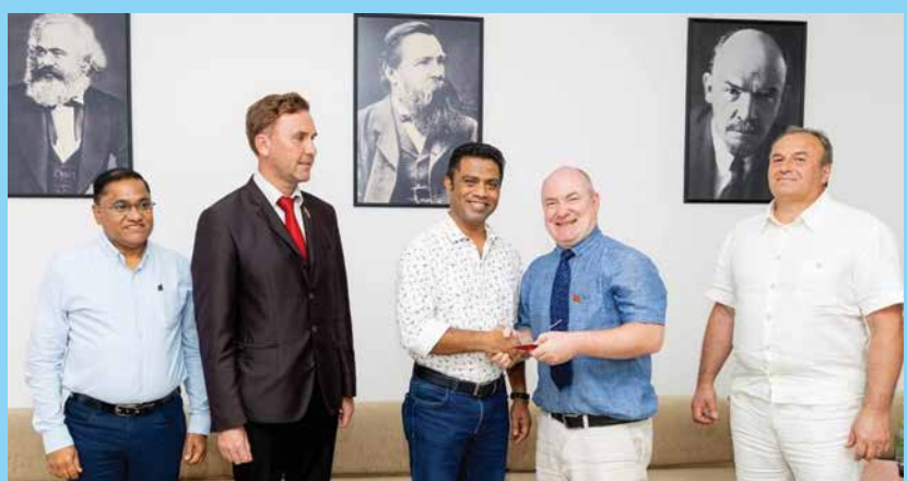
Communists of Russia පක්ෂය සමග හමුවක්...