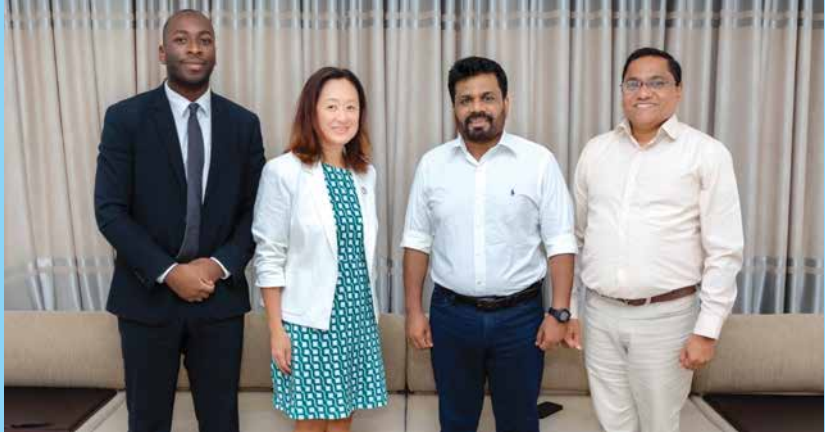
ශ්‍රී ලංකාවේ එක්සත් ජනපද තානාපතිනිය හමුවී...