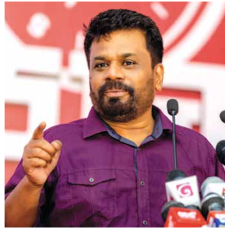
ජාතික ජන බලවේගයේ නායක අනුර කුමාර දිසානායක සහෝදරයා

පසුගිය අවුරුදු 20 තුළ ලෝකය මහා ජයග්‍රහණ අත්පත් කරගෙන තිබෙනවා. අපේ පාලකයෝ ඒ කාලය තුළ අපේ