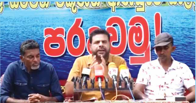
ජල සම්පත විකිණීමට එරෙහිව හඬ නගා...