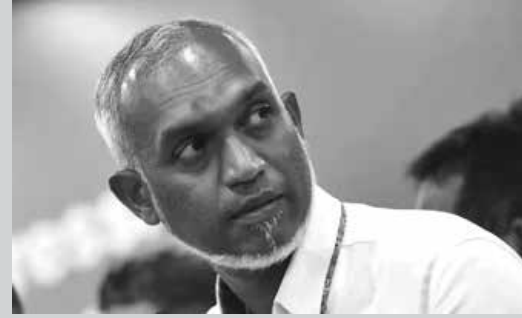
පසුගිය ඔක්තෝබර් මාසයේ දී පැවැති මාලදිවයින ජනාධිපතිවරණයෙන් ප්‍රගතිශීලී සන්ධානය නියෝජනය කරමින් තරග වැදුණු මොහොමඩ් මුසිසු

54%ක ඡන්ද ප්‍රතිශතයක් ලබා ගනිමින් ජයග්‍රහණය කර තිබේ. ඔහු එළඹෙන නොවැම්බර් 17 වන දින මාලදිවයිනේ ජනාධිපතිවරයා ලෙස දිවුරුම් දීමට නියමිතය. ජයග්‍රහණයෙන් පසු ඔහු බිබිසි ප්‍රවෘත්ති සේවය හමුවේ ප්‍රකාශ කර තිබුණේ ඔහුගේ පාලන කාලය තුළ මාලදිවයින භූමියෙහි විදේශ හමුදා රැදී සිටීමට ඉඩ නොතබන බවය. දැනට ඉන්දියාව විසින් ලබාදෙන ලද ගුවන් යාන ඇතුළු උපකාර නඩත්තුව සඳහා ඉන්දියන් හමුදා සාමාජිකයන් 75 දෙනෙකු පමණ මාලයෙහි රැදී සිටින බවට ගණන් බලා තිබේ.