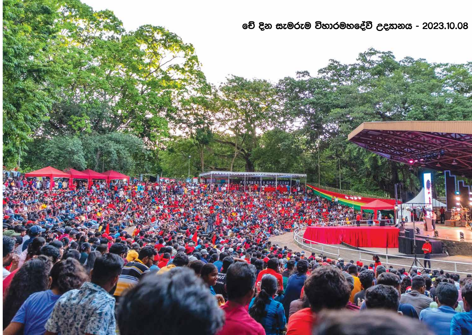
වේ දින සැමරුම විහාරමහදේවී උද්‍යානය - 2023.10.08

ඒ කඳු මුදුනතින් හැඟී සහෝදරත්වයේ උල්පතට ලියන්නෙලි නැවත කවියක් දුර්භාග්‍යය තවදුරටත් ඇවිද යයි නිමිත ගම්බිම් මත පිඩාව මහෝසයක් වී පෙළයි දවයි හඬවයි මහමුහුද සේ අතර හැති දරුවෝ ඉක්කසා හඬති උදෑසන ගෙවල විසපත් වැඩිහිටියෝ අනුලති ඉඳුල් බඳුන්වල විරැකියා මන්දපෝෂණ බෙහෙත් හැති ඉස්පිරිතාල ආන්මාර්ථයේ ගිල්වූ මිනිස් නොමිනිස් කෙළිපිලි මරණය තිබේ හැම දොර ඉදින් ලියනෙලි කවියක් කිසිදුක ගිලා නොබසින ජන හඳෙහි පැන හැඟී සහෝදරත්වයේ මහ කන්දට කඳු පතුල ඉපිද කඳු මුදුනතට හැඟ සිව් දිගට ගලා ගිය රතුම රතු හඳවතට සිව් දිගට ගැඹු දිය උල්පත්වලට මිනිසත්කමේ ගුණ සුවද හුස්මී තැවිරූ රතු හඳවත්වලට හඳවතෙහි ගැඹුරින් විජලවය පැන හැඟිය යුතු බව පතුලෙහි ඇති හේතුවම උදුරා දමන තුරු පවතින බව අර්බුදය උගන්වනෙලි අපි ඕබෙන් මේ මහා කන්ද මත රතු මල් පිපෙන යුගයයි වසන්තය හොයාගෙන කොවුලන් ගසන යුගයයි ඉල්ලමනේ ගනුදරෙහි ගමන දැන් දැන් නිමයි වසන්තය හුදුරෙදිම අරැන හුම් හුම් මයි (35වැනි ඉල්මන විරු සමරුව වෙනුවෙන්)