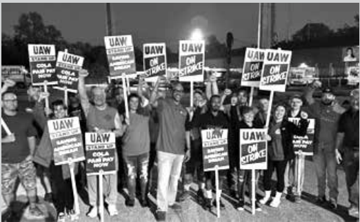
එක්සත් ජනපදයේ විශාලතම මෝටර් රථ නිෂ්පාදන සමාගම් තුනෙහි සේවකයින් ආරම්භ කළ වැඩවරුන්ගේ ඔක්තෝබර් 31 දින ජයග්‍රහණයෙන් අවසන් විය. ස්ටෙලැන්ටිස්,

ෆෝඩ් සහ ජෙනරල් මෝටර්ස් සමාගම්හි සේවකයන් මෙම වැඩවරුන්ගේ ආරම්භ කරන ලද්දේ පසුගිය සැප්තැම්බර් 15වැනි දාය. එකත වූ නව වැටුප් වැඩි වීම අනුව කම්කරු වැටුප පැයකට ඩොලර් 40ට වඩා වැඩි වනු ඇතැයි අපේක්ෂා කෙරේ.