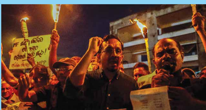
විදුලි බිල වැඩිකිරීමට එරෙහිව...