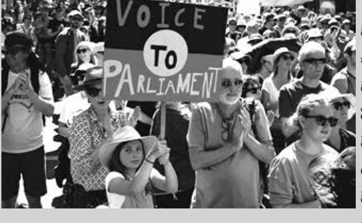
ඕස්ට්‍රේලියා නූ ව්‍යවස්ථාව තුළ එරට ස්වදේශික ජනතාවට පිළිගැනීමක් ලබා දීම සඳහා වූ ජනමත විචාරණයෙන් එකී යෝජනාව ප්‍රතික්ෂේප වී තිබේ. එහිදී යෝජනා කර තිබුණේ එරට ස්වදේශික ජනතාව වෙනුවෙන් පාර්ලිමේන්තුව තුළ 'ස්වදේශික උපදේශක සභාවක්' ගොඩනැගීමටයි. මෙම යෝජනාවට එරෙහිව 60%ක ඡන්ද ප්‍රමාණයක් ලැබී තිබුණු අතර ඊට පක්ෂව ලැබී තිබුණේ සියයට හතළිහකට ආසන්න ඡන්ද ප්‍රමාණයක් පමණි.