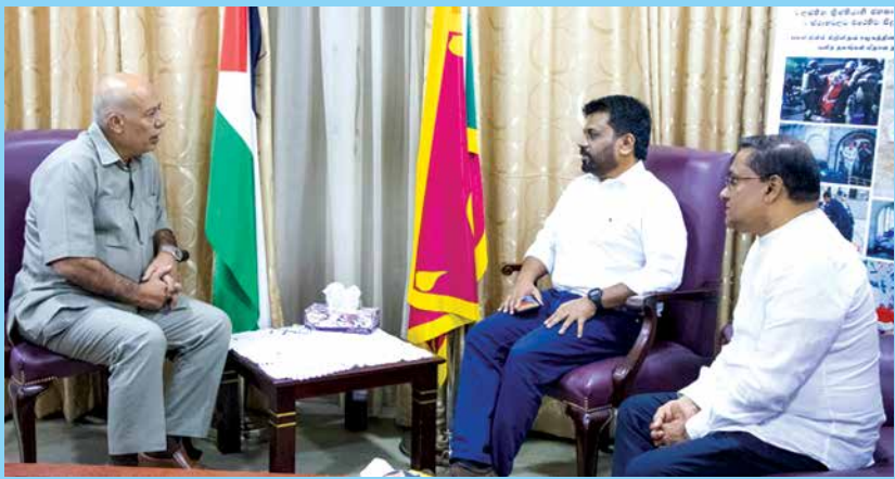
පලස්නීන ජනතාවගේ වේදනාව බෙදාගනිමින්...