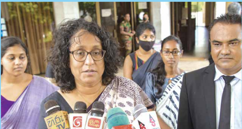
Online ජනතා එරෙහිව අධිකරණයට