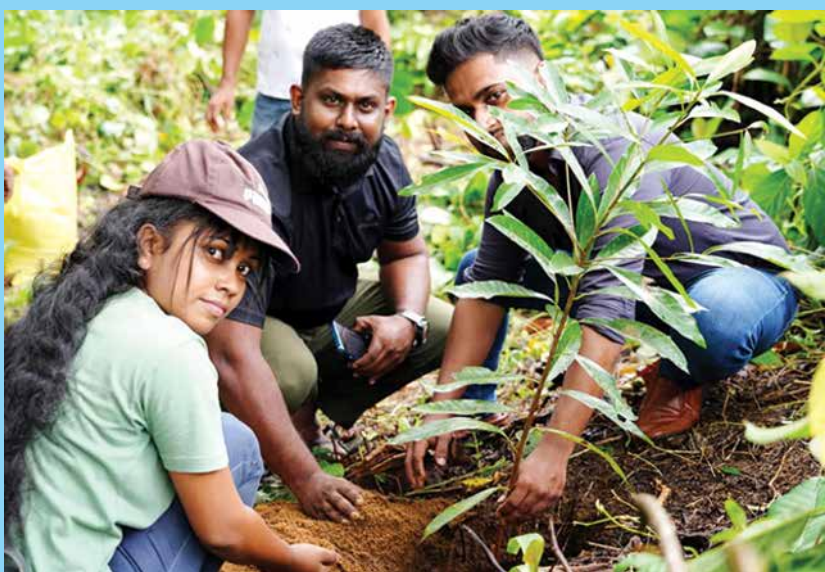
පරිසර පද්ධතිය රැකගැනීම වෙනුවෙන්...