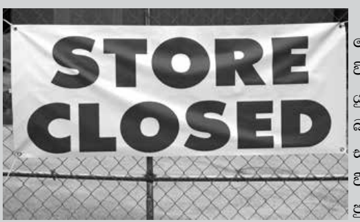
2023 වසරේ දෙවන කාර්තුව වන විට, වසර අටක් තුළ, යුරෝපා සංගමයෙහි බංකොලොත් වූ වැඩිම සමාගම් ගණන වාර්තා වී තිබේ. අප්‍රේල් හා ජුනි අතර ව්‍යාපාරවලින් ඉවත් වූ සමාගම්

ගණන පෙර කාර්තුවට වඩා 8.4%කින් ඉහළ ගොස් තිබේ. ආහාර සේවා සමාගම්වලින් 23.9%ක් ප්‍රවාහන හා ගබඩා සමාගම්වලින් 15.2%ක් අධ්‍යාපන, සෞඛ්‍ය හා සමාජ ක්‍රියාකාරී ක්ෂේත්‍රයෙහි සමාගම්වලින් 10.1% ක් මෙලෙස බංකොලොත් වී තිබේ.