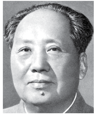
"සමාජයේ වෙනස්වීම සිදුවන්නේ එහි පවතින ප්‍රතිවිරෝධයන්ගේ වර්ධනය හේතුවෙනි. නිෂ්පාදන බලවේග සහ නිෂ්පාදන සම්බන්ධතා අතර ප්‍රතිවිරෝධයේත්, පංති අතර ප්‍රතිවිරෝධයේත්, අභාවයට යන පරණා දේ හා නැති එන අලුත් දේ අතර ප්‍රතිවිරෝධයේත් වර්ධනය හේතුවෙනි. පැරණි සමාජය යට කරගෙන අලුත් සමාජයට ඉදිරියට වර්ධනය වීමට ඉඩ දෙන්නේ මේ ප්‍රතිවිරෝධය නිසාය."