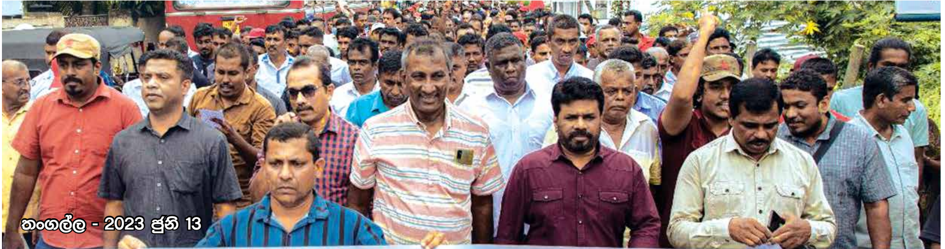
තංගල්ල - 2023 ජූනි 13