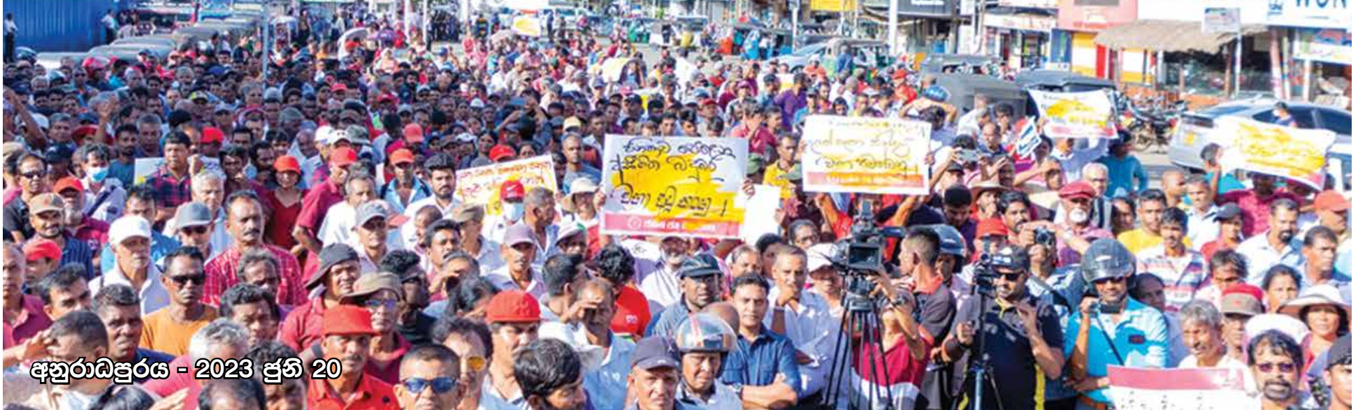
අනුරාධපුරය - 2023 ජූනි 20