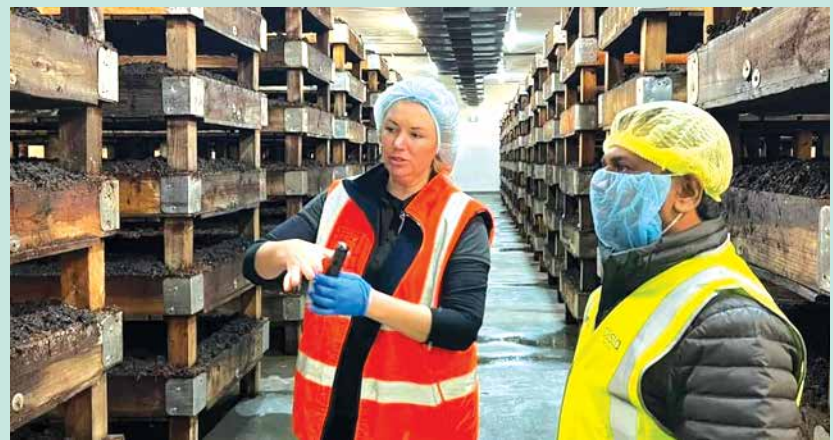
ඕස්ට්‍රේලියාවේ කෘෂි නිෂ්පාදන කම්හලක නිරීක්ෂණය