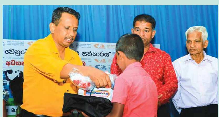
හොඳම දේ දැරුවන්ට