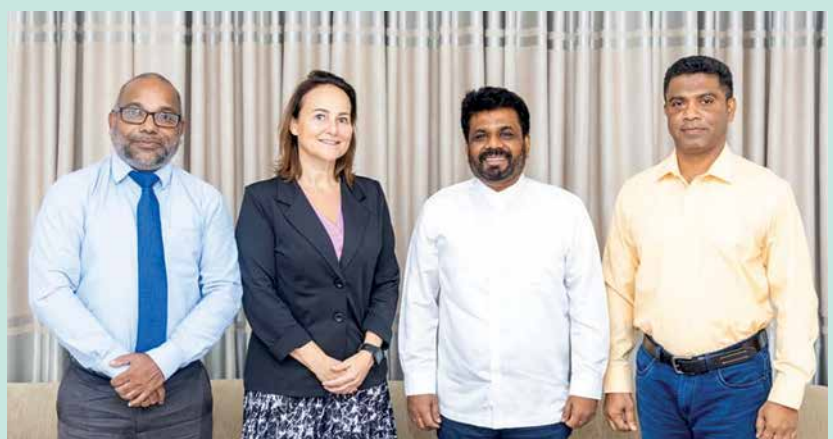
නෙදර්ලන්ත තානාපති සමග