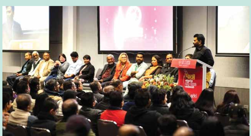
ඕස්ට්‍රේලියාවේ පර්ත් විහිසුණු ජන හමුවක් අතර