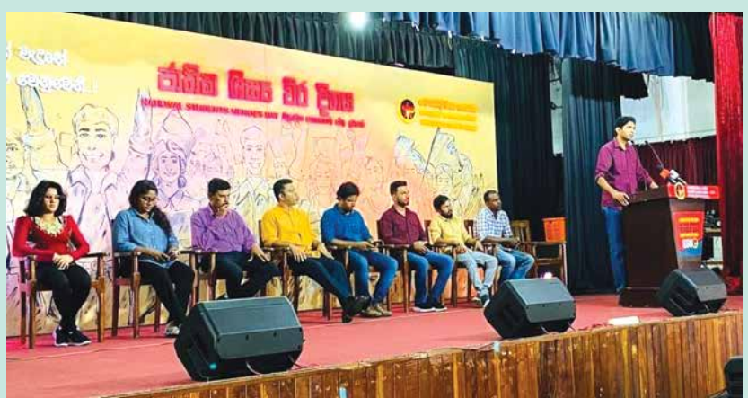
ශිෂ්‍ය විර දිනය සමරමින්