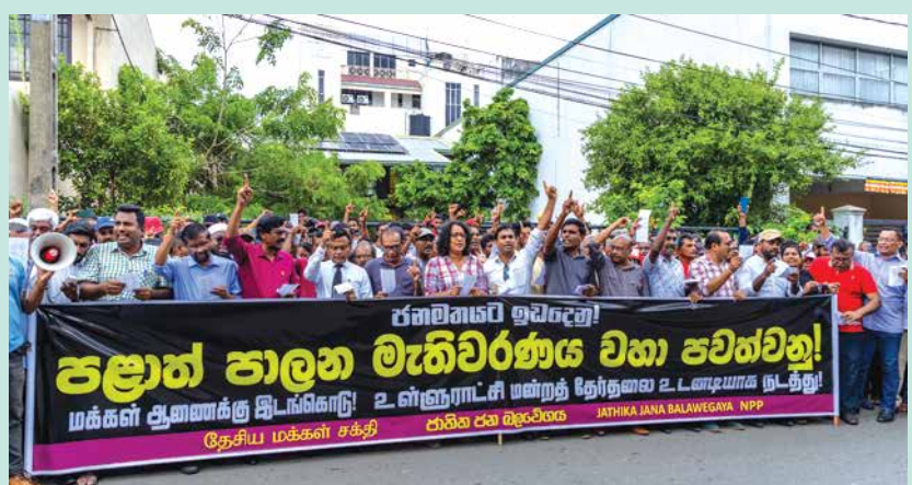
පළාත් පාලන මැතිවරණය ඉල්ලා විදි බැස