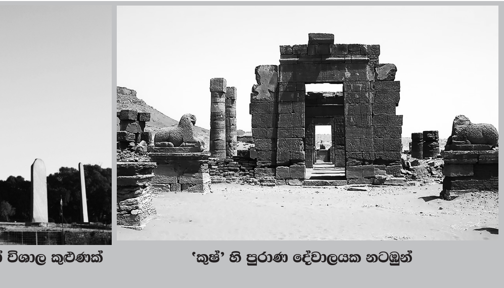
'කුෂ්' හි පුරාණ දේවාලයක හටමුන්

පුළුල් භූගෝලීය සහ දේශගුණික වෙනස්කම් ගණනාවක් ඇතුළත් විවිධත්වයක් එකම මහාද්වීපික ගොඩබිමක් මත තිබෙන තත්ත්වයක් තුළ ඒ ඒ ලක්ෂණවලට අනුරූපව ශිෂ්ටාචාරික සමාජය නිර්මාණය කර ගැනීමට මිනිසාගේ සමත්කම දැක්වීමට හොඳම නිදසුනක් වනුයේ අප්‍රිකානු ශිෂ්ටාචාරයයි.